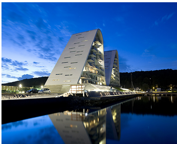
COTO 62 // TRÆ/ALU