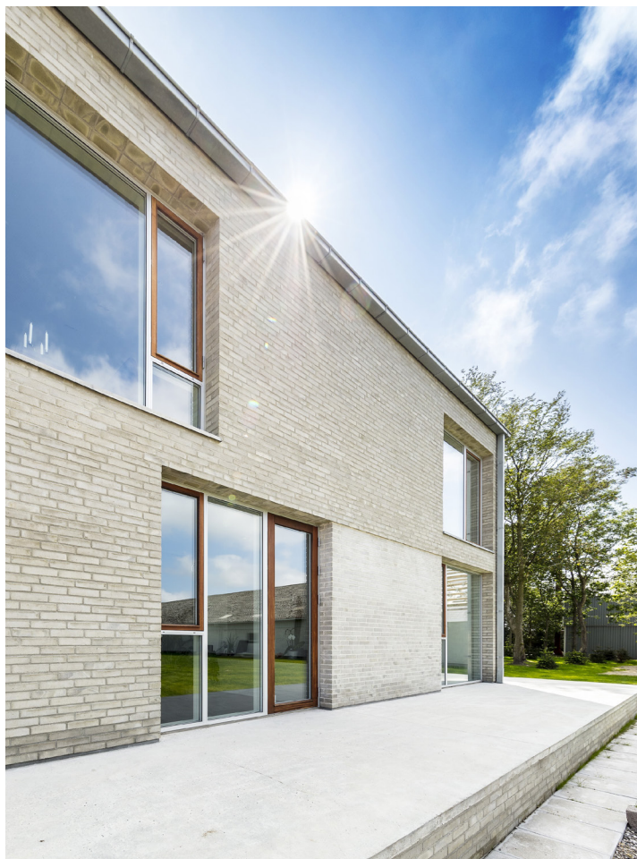
COTO 62 // TRÆ/ALU