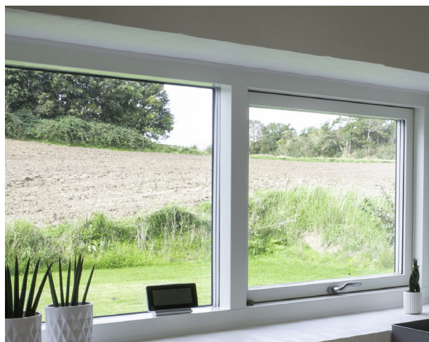
COTO 62 // TRÆ/ALU