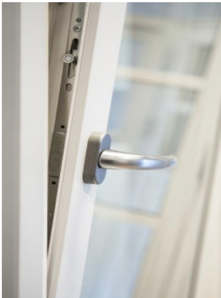
KRONE FLEX // TRÆ/ALU