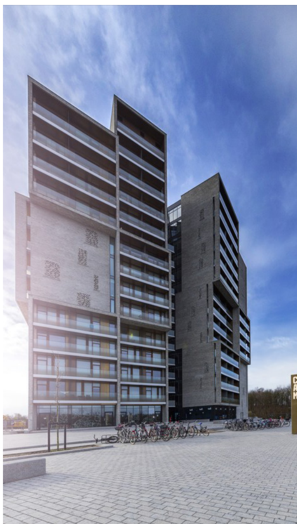
KRONE FLEX // TRÆ/ALU