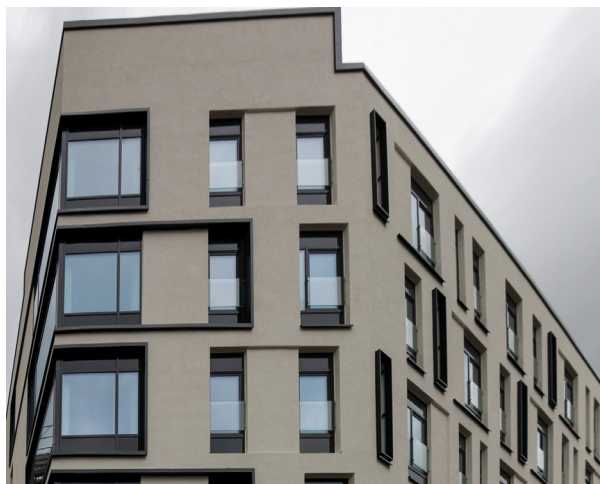
KRONE FLEX // TRÆ/ALU