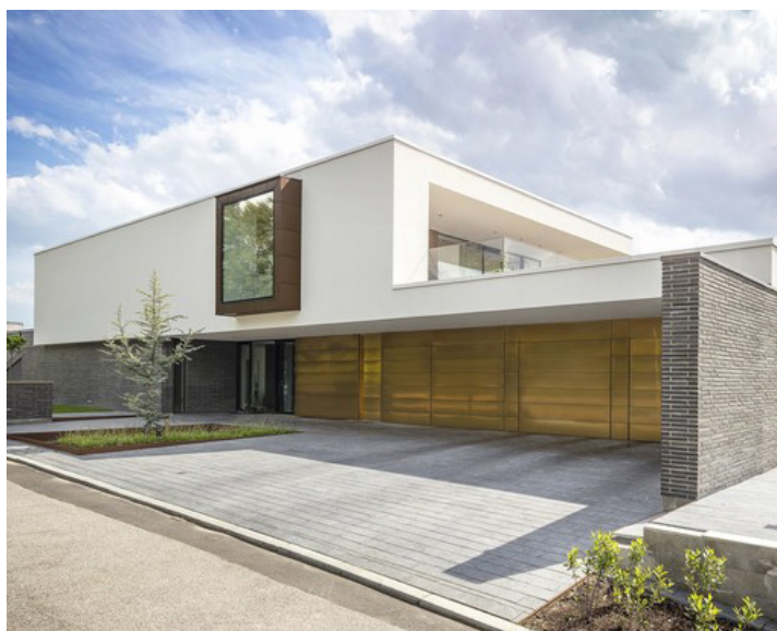
KRONE FLEX // TRÆ/ALU